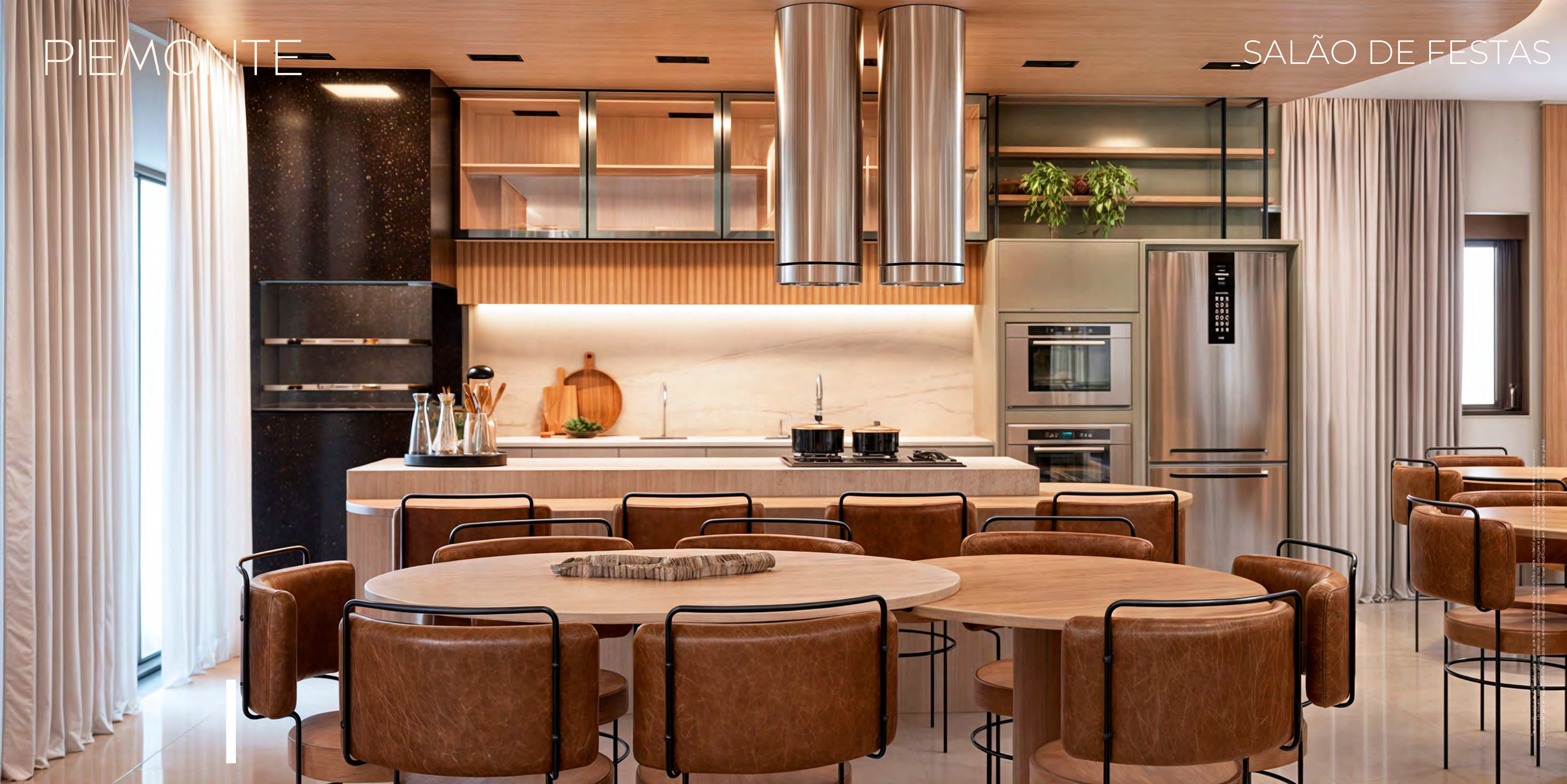
Imagem meramente ilustrativa. O projeto foi desenvolvido por um escritório de arquitetura especializado em interiores. O espaço é um ambiente planejado para proporcionar conforto e praticidade. © 2023 - Todos os direitos reservados.